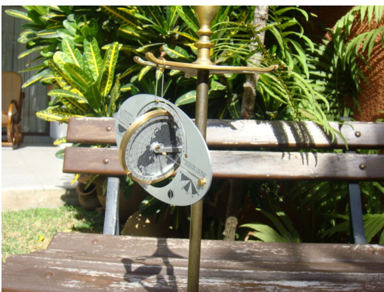
ICARUS vor meinem Haus in Funktion.

Nachdem ich sie in meinem Haus geprüft hatte, setzte ich sie anschließend auf dem Land ein.