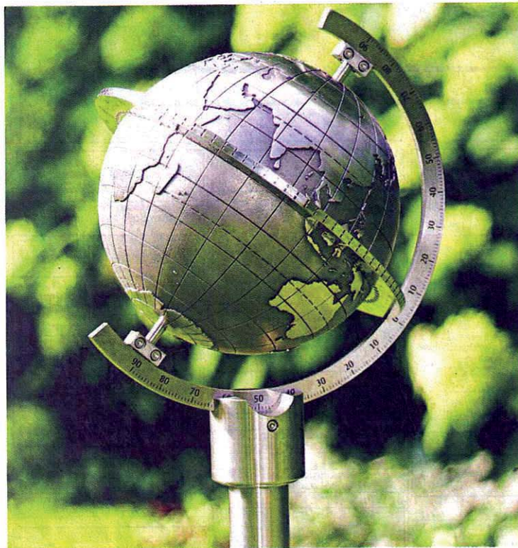
Auch ohne Sonne ein Blickfang: Die Mondo von Helios ist ein Modell der Welt als Uhr.