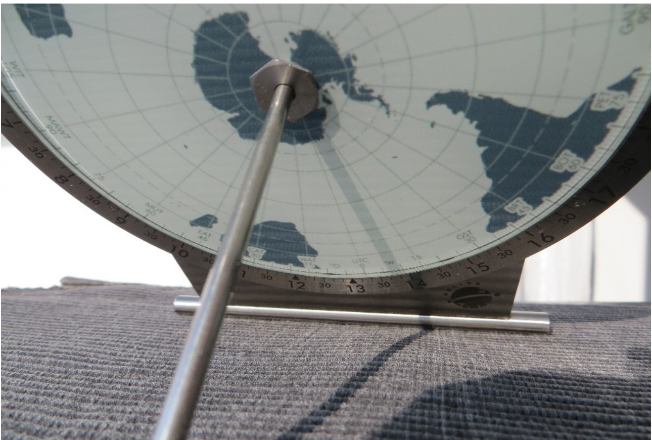
Schattenlinie auf der Südseite der Äquatorscheibe um 13:46 Uhr am 09.02.2013