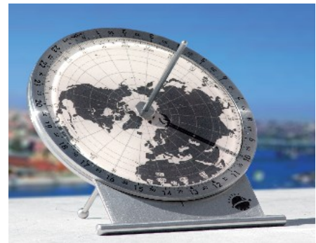
HELIOS - POLARIS

Nichts Besonderes, - denkt man, - saubere Sonnenuhr eben. Aber der Lichtpunkt zeigt mehr: Er kann auch die Uhrzeit anzeigen!